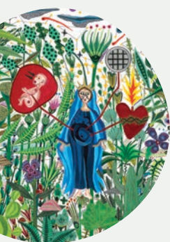
Détail de l'oeuvre Je t'offre la fureur du monde. Catherine Hélie-Harvey, 2019.